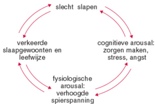
Figuur 1 De vicieuze cirkel van langdurige slapeloosheid. 4